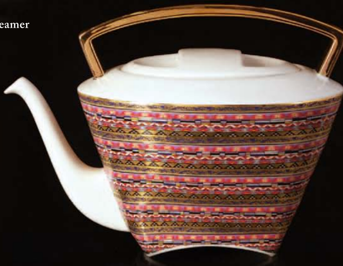
konvice / kettle 2 díly/ 2 parts, 1, 5 l

WO-MAN, woman and man, žena a muž, renesanční téma v modernistickém pojetí. Všechny vyjmenované pojmy se dají dohledat při pohledu na novou porcelánovou nápojovou soupravu Atelieru Lesov. Prolínání ostrých linií obdélníku a oblých linií elipsy, lze vytušit komunikaci mezi mužským a ženským principem. Někde v hloubi duše autora je přání k zastavení se a nalezení klidných chvil při kávě či čaji a přátelských rozhovorech, které z dnešního životního stylu téměř vymizely. Autorem výtvarného návrhu je Martin Přibík.