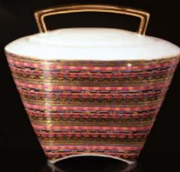
cukřenka / sugar bowl 2 díly/ 2 parts, 200 ml