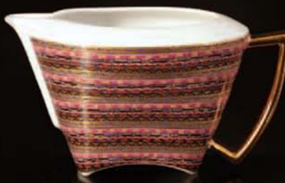
mlékovka / creamer 200 ml