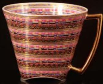
šálek / cup 200 ml