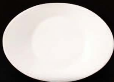
podšálek / saucer 130 mm