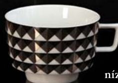
nízký šálek čaj / cup 150 ml