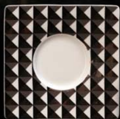
podšálek / saucer 160 mm