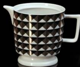
mlékovka / creamer 250 ml