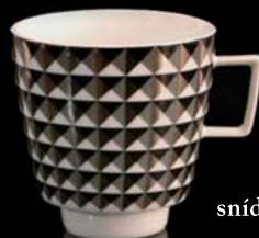
snídaňový šálek / cup 300 ml