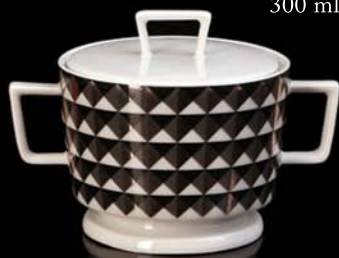
cukřenka / sugar bowl 2 díly / 2 parts 300 ml